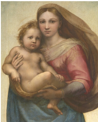
Maria, Regina della pace, prega per noi!