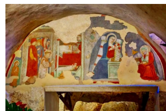
Il Presepe di Greccio