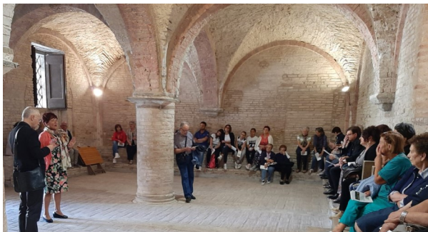
I 55 turisti-pellegrini (da 10 a 92 anni!) nella Sala del Capitolo all’Abbadia di Fiastra

In ultimo... la processione! Vedevo la statua della Madonna allontanarsi sempre più dalla mia vista man mano che la gente si aggiungeva. Mi sentivo sempre più inebriato di Spirito e, nelle mie preghiere, tra i grani del Rosario facevo scorrere l’umanità intera assieme ai miei cari.