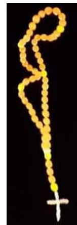
Il Rosario di palloncini si libra nel cielo di Loreto al termine della processione