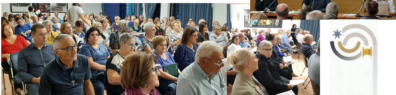
Il Logo della Visita